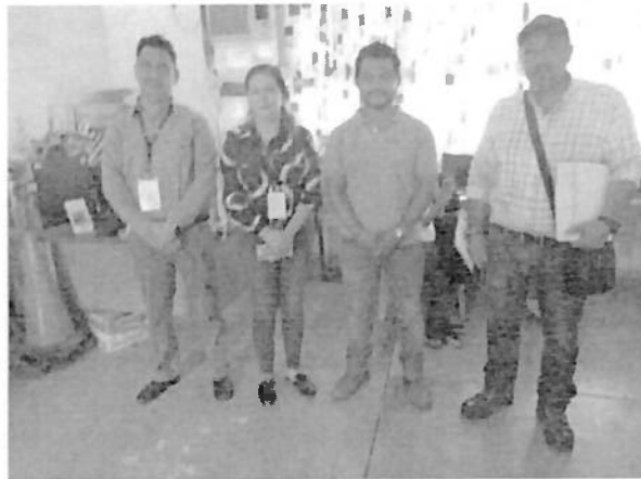
Reunión en la casa de la cultura del municipio de Unión Hidalgo con autoridades Municipales 06/12/2023.