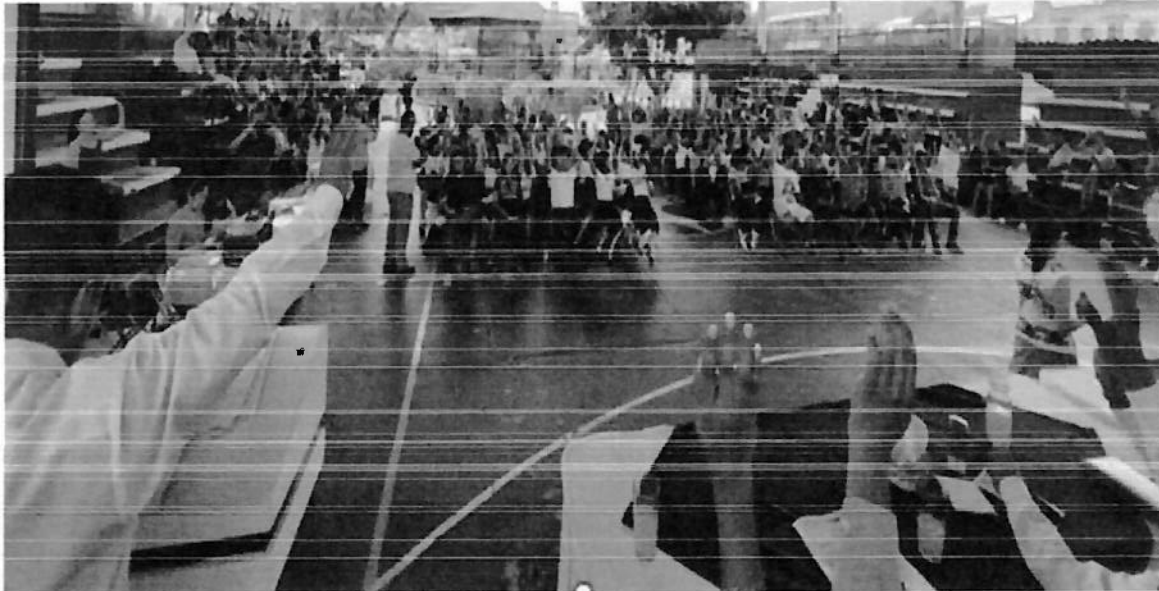
San Juan Cahuatpec 4 de septiembre de 2023