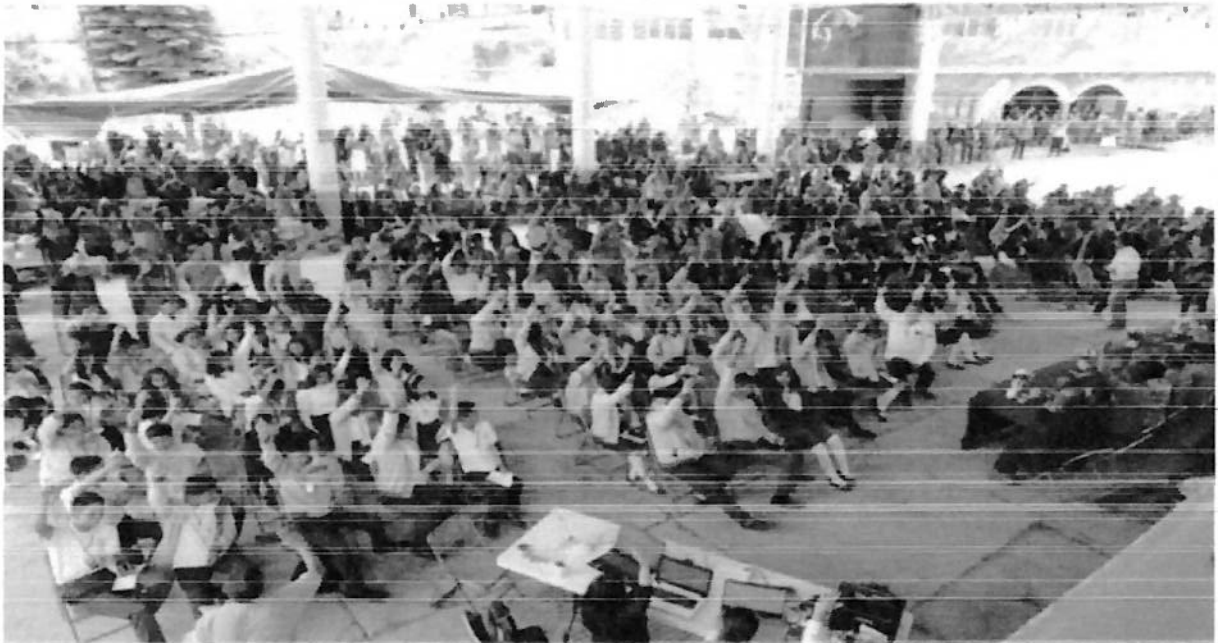
San Juan Quiahije