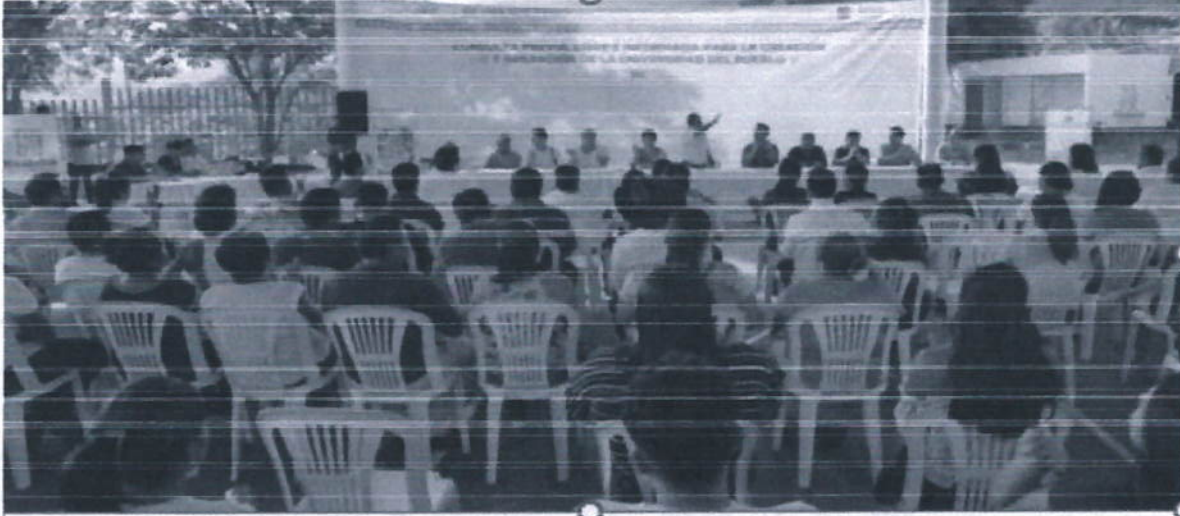
Santa María Huatulco 8 de septiembre de 2023