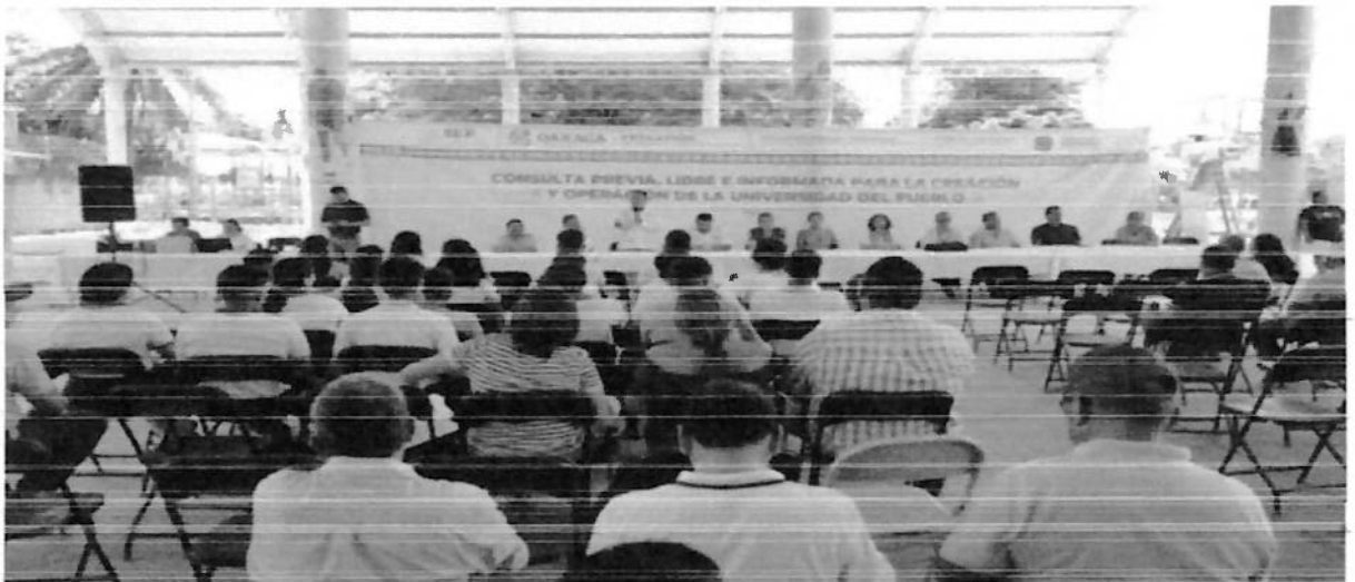
San Pedro Pochutla 7 de septiembre de 2023.