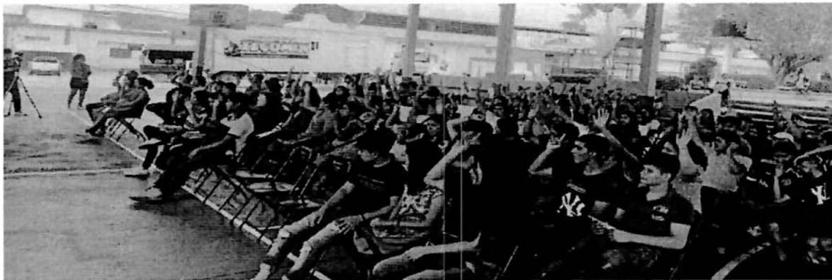
Votación de los jóvenes en la Consulta Previa. Libre e Informada presidum y al fondo mesa de trabajo de la relatoria en San Andrés Huaxpaltepec. 17/06/2023.