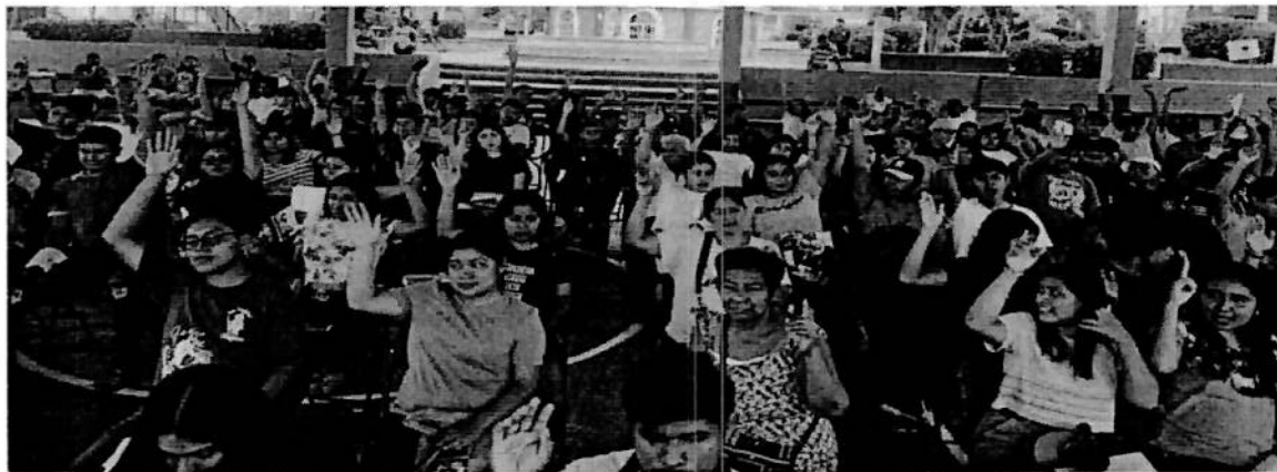
Votación de la Consulta Previa, Libre e Informada para la creación de la Afrouniversidad Politecnica e Intercultural en San Andrés Huaxpaltepec. 17/06/2023.