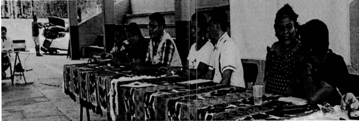
Personal del presidium Consulta Previa, Libre e Informada para la creación de la Afrouniversidad Politécnica e Intercultural en San Andrés Huaxpaltepec. 17/06/2023.