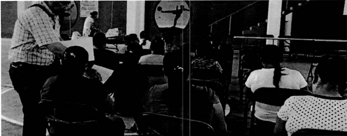
Inicio de la Consulta Previa. Libre e Informada en el proceso de pase de lista a las personas de la comunidad e instalación de los equipos para trabajar en San Juan Colorado. 16/06/2023