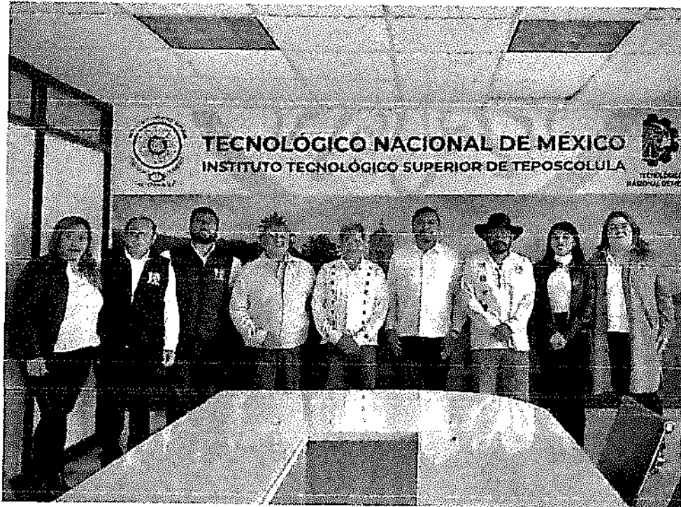
Personal Administrativo y Directivo del ITS Teposcolula y Autoridades educativas en el Instituto Tecnológico Superior de Teposcolula.